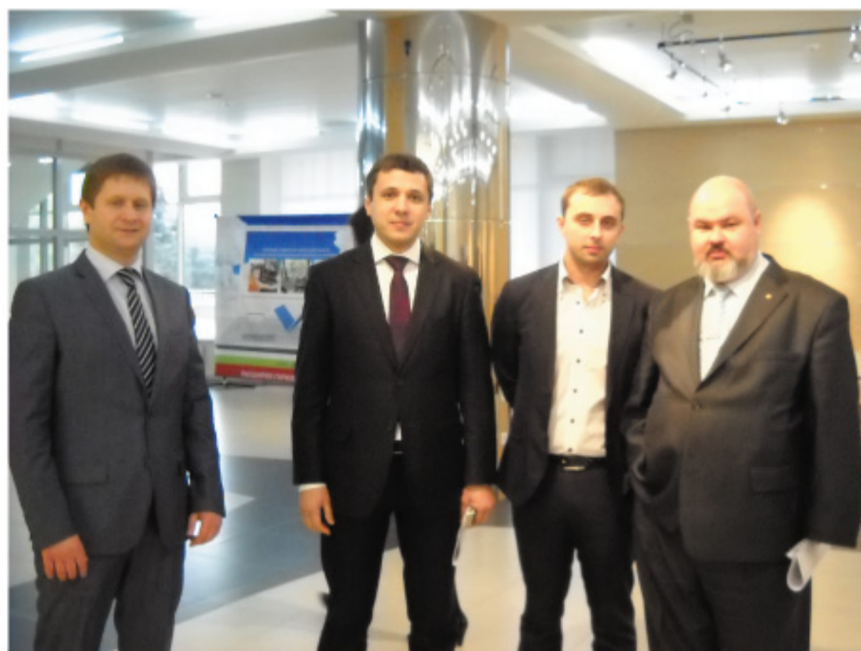
Хозяева мероприятия – известные руководители тюменских инноваций

Он не только выступил с программной речью перед слушателями, но и рассказал, как основал собственное дело 27 лет назад, когда ему было всего 13: «Я открыл бизнес в небольшой деревеньке в Финляндии, в которой проживало чуть более 400 жителей, был один магазин и электричество, но не было полиции и банка. И все же там было возможно начать бизнес, который вырос постепенно до нынешних масштабов: 20 тысяч