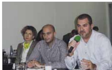
Гости из разных стран задавали вопросы