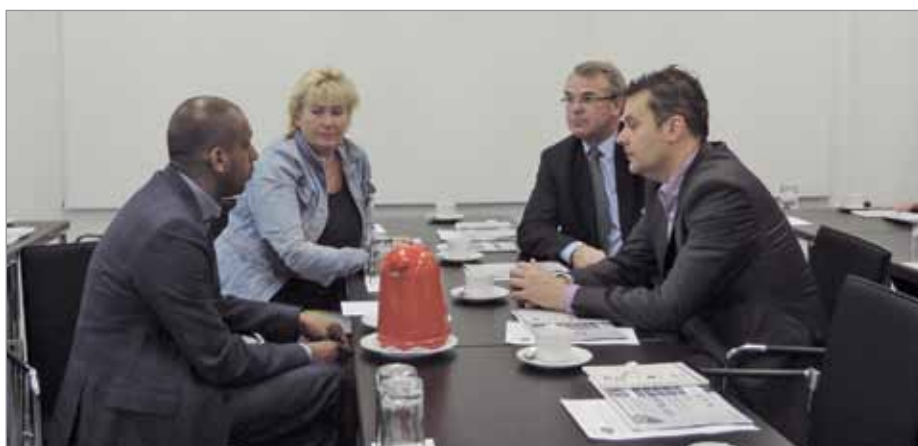
Обсуждение продолжилось после мероприятия

водческой отрасли». На саммите будут рассмотрены актуальные тенденции производства и потребления мясной и рыбной продукции, вопросы безопасности и качества, перспективные